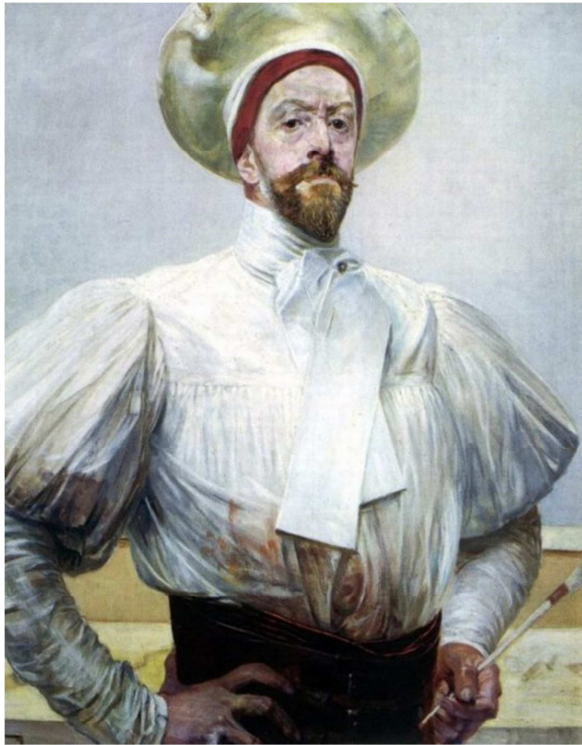
Jacek Malczewski, "Idź nad strumienie" (środkowa część tryptyku), 1909-10, olej na tekturze