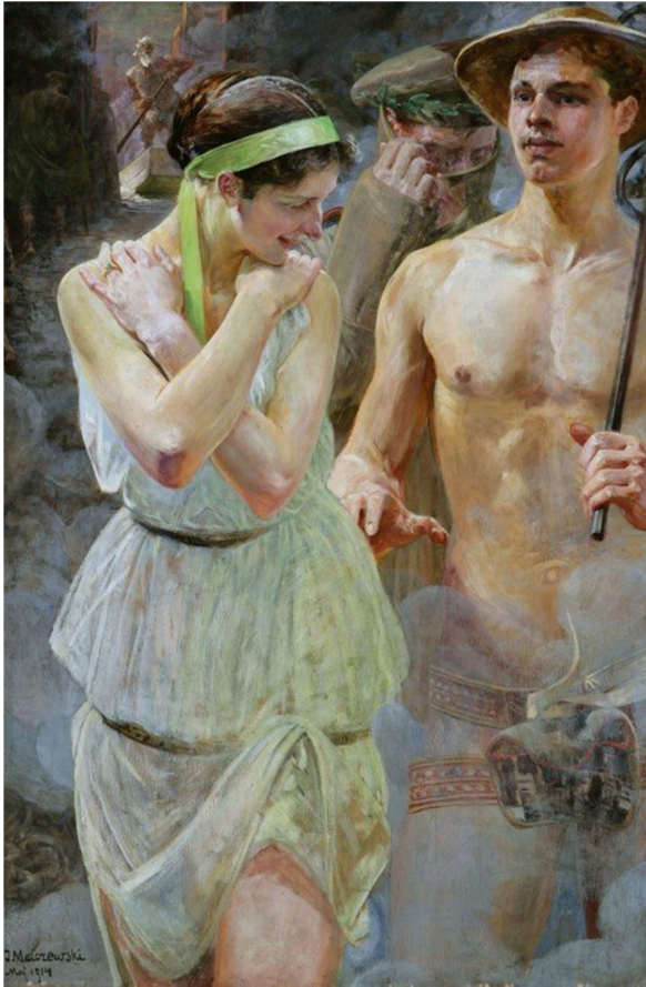
Jacek Malczewski, "Polonia", 1914, olej na tekturze, 145 x 98,5 cm, fot. pochodzi z prywatnej kolekcji