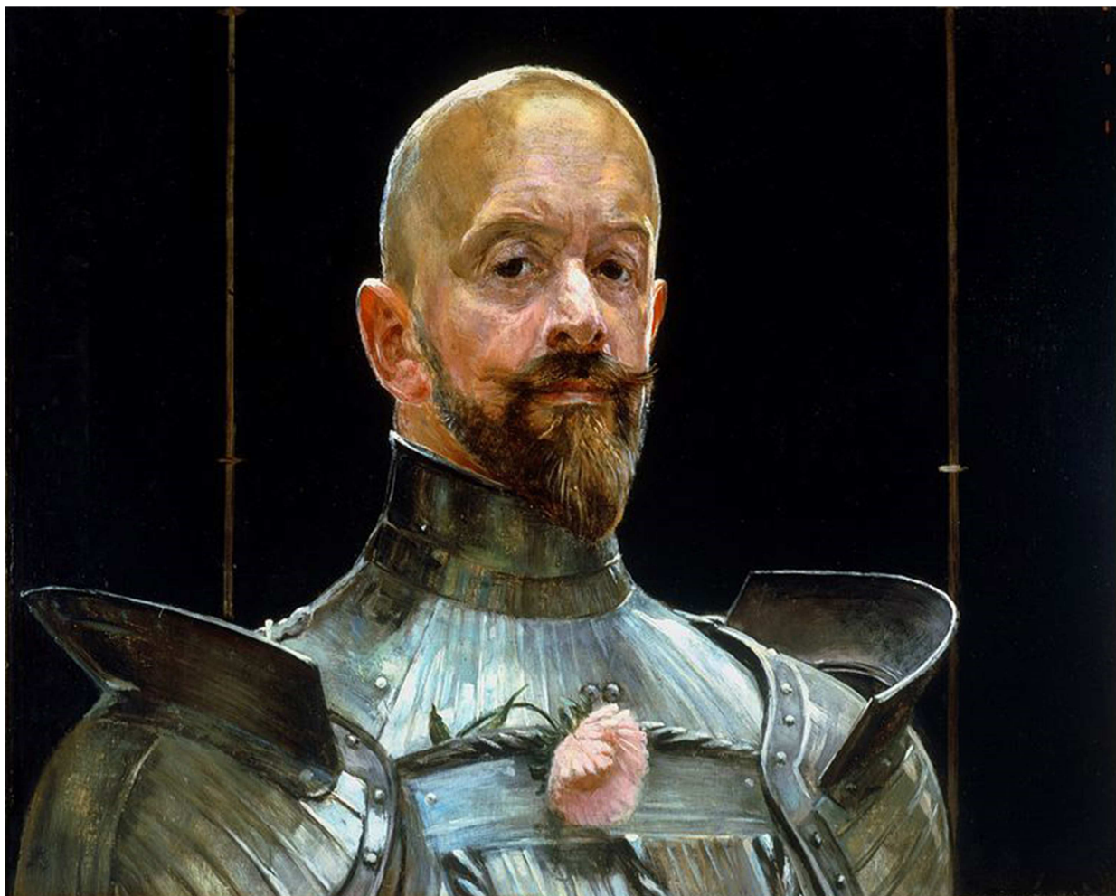
Jacek Malczewski, "Autoportret w zbroi", 1914, olej na tekturze