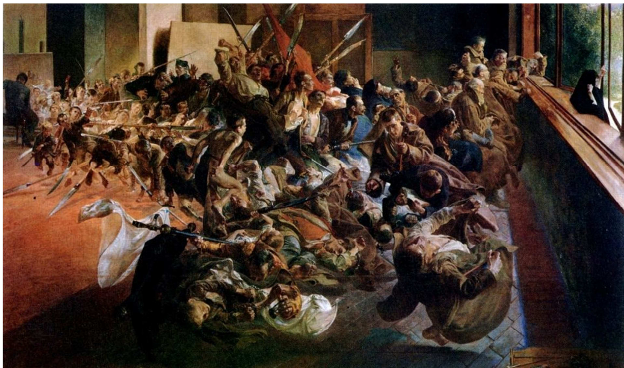
Jacek Malczewski, "Melancholia", 1890-1894, olej na płótnie, 139 x 240 cm