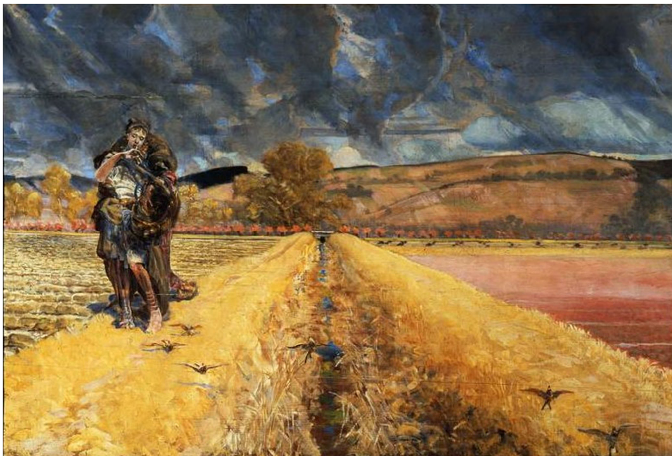
Jacek Malczewski, "Święta Agnieszka", 1920-1921, olej na desce, 80 x 120 cm