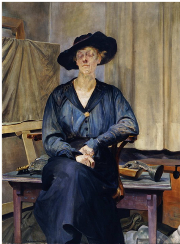
Jacek Malczewski, "Portret żony artysty", 1920, olej na płótnie, fot. Muzeum Okręgowe w Bydgoszczy